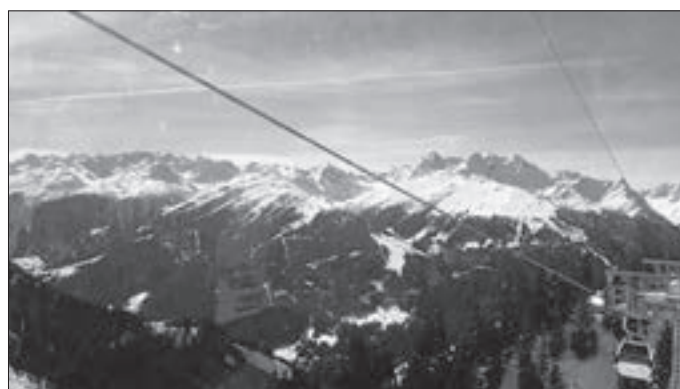
Foto: Blick von der Hochjochbahn zur gegenüberliegenden Silvretta, von Diana Hasis