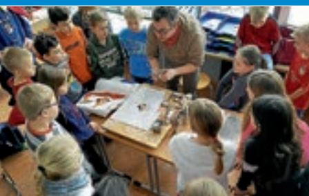
Schlossbergschule Wehingen: S'isch Fasnet...