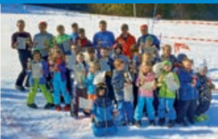
Skiclub Egesheim: Skirennen vom 17.02.2019