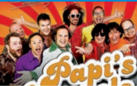
„Papi's Pumpels: 13.4.2019, Stadthalle Wehingen