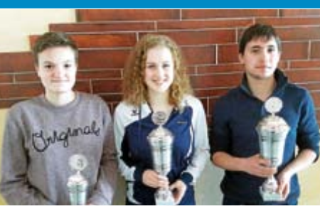
Vereinsmeisterschaft der Schwimmer