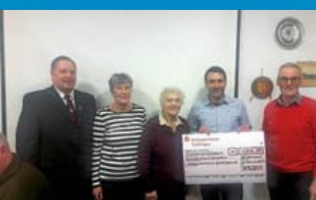
Albverein Reichenbach ehrt und spendet