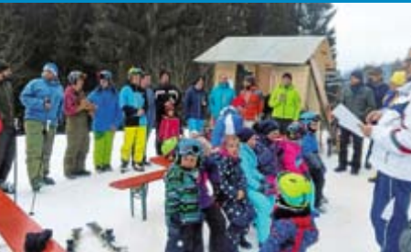
Skiclub Wehingen: Vereinsmeisterschaften