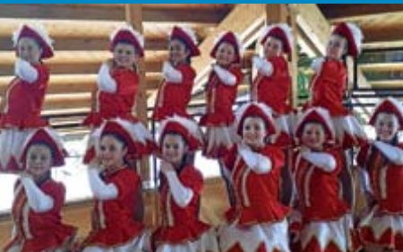
NZ Reichenbach gratuliert ihren Gardemädels!