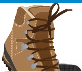
Bergtour der Albvereine Wehingen und Reichen- bach, 14. bis 16. Sept. 2018