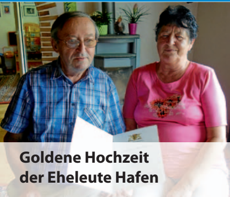
Goldene Hochzeit der Eheleute Hafen