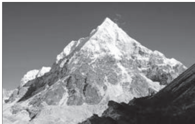
Jasemba 7350 m

lerkofel, der Heiligkreuzkofel - Prachtberge wo man auch hinschaut bei dieser eindrucksvollen Reise. Die eisigen Flanken der Zillertaler Alpen, die Gipfel der heimatlichen Rieserfernergruppe, das Tauferer Ahrntal in Südtirol, der erste Dreitausender und die hinreißende Erzählung von der Besteigung des Moosstock, so hoch über dem elterlichen Bauernhof. Es sind die kleinen Geschichten hinter der Geschichte, mit denen Hans Kammerlander einen interessanten Spannungsbogen über sein bergsteigerisches Leben legt.