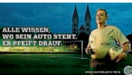
FC Reichenbach - Karriere als Schiedsrichter