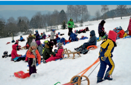
Raus aus der Schule rein in den Tiefschnee.