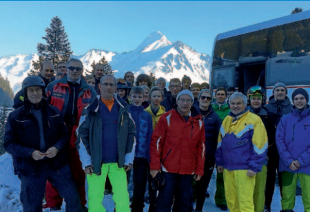
Skiclub in Damüls