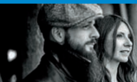
Der Kulturverein lädt ein: Am Sonntag, 7. Januar 2018