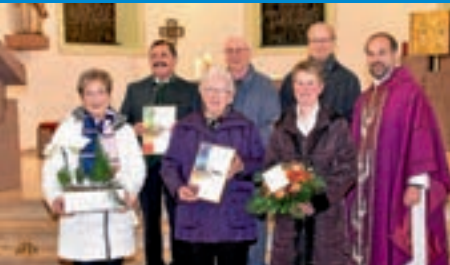
Kath. Kirchenchor ehrt Sängerinnen und Sänger