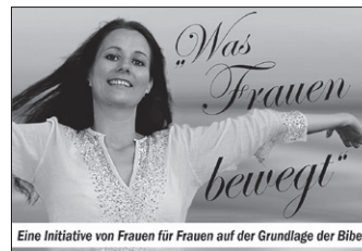
Eine Initiative von Frauen für Frauen auf der Grundlage der Bibel.

„Vom Himmel hoch da kommt noch mehr – Festtage-Stresstage?..“