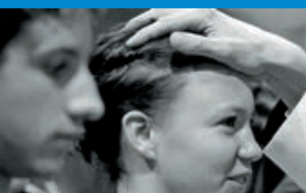
Am 25.11.17 Spendung des Firm-Sakraments