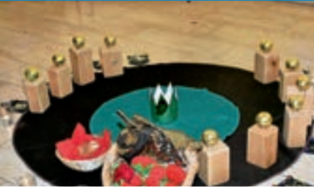
Martinsspiel im Kiga Christkönig und St. Ulrich