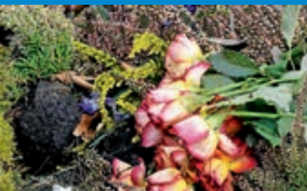
Ewigkeitssonntag am 26. November 2017