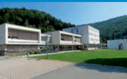
Generalsanierung des Grundschulgebäudes