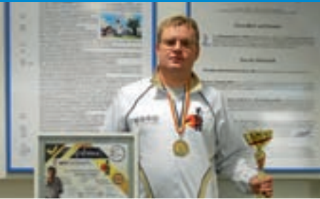
Neuer Wehinger Doppel-Weltmeister