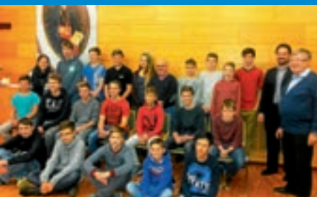
Projekt „Claretiner -Dreifaltigkeitsberg“