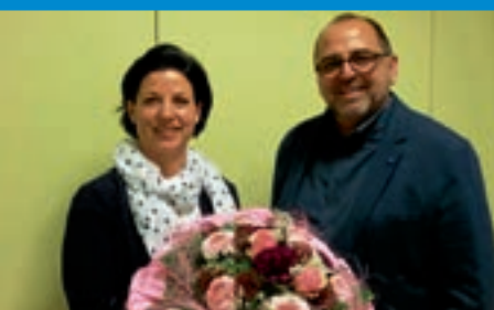
Neue Vorsitzende beim För- derverein des Gymnasiums