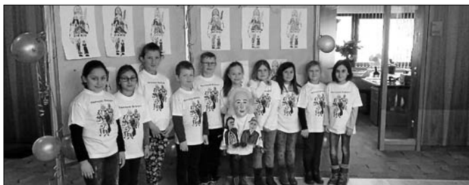
Die Sieger des Malwettbewerbs mit ihren T-Shirts