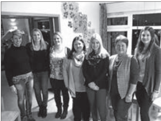
Team des Kindergartens „Bischof Wilhelm von Reiser“

Der Kommunalverband für Jugend und Soziales Baden-Württemberg hat der Gemeinde die Betriebserlaubnis für die Aufnahme von Kindern unter 3 Jahren erteilt. Zu Beginn der Sitzung führten die Mitglieder des Gemeinderates mit den Erzieherinnen und interessierten Eltern ein Gespräch über die künftige Aufnahme von Kindern unter 3 Jahren sowie über erforderliche Anschaffungen, Öffnungszeiten und über die Festsetzung von Elternbeiträgen. Kinder unter 3 Jahren werden zum frühestmöglichen Zeitpunkt bzw. bis spätestens zum Kindergartenjahr 2017/2018 aufgenommen. Den erforderlichen Anschaffungen (Wickelkommode etc.) stimmte der Gemeinderat zu.