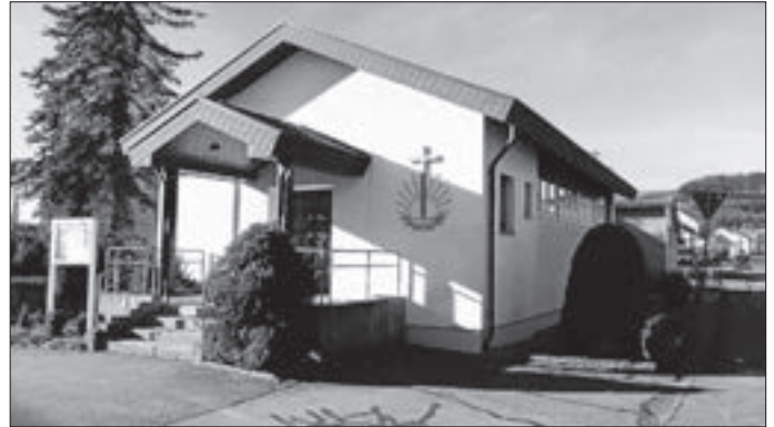
bisherige Kirche in der Wiesenstr. 26 in Wehingen

konnte bald eine Baracke zum ersten eigenen Kirchenlo- kal herrichten. 1963 baute die Gemeinde in der Wiesen- straße ihr Kirchengebäude, das bis heute genutzt wurde. Was mit diesem Kirchlein geschehen wird steht noch nicht fest. Die künftigen Gottesdienste finden sonntags um 9.30 Uhr und mittwochs um 20.00 Uhr in Spaichin- gen, Sudetenstraße 35 statt.